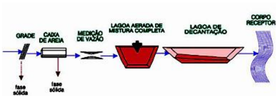
Figura 05 – Fluxograma de um sistema de lagoas aeradas de mistura completa lagoas de decantação.

Na figura 05 está representado um fluxograma de um sistema de lagoas aeradas de mistura completa – lagoas de decantação. Os dispositivos que estão situados antes da lagoa aerada de mistura completa (alto nível de aeração) tem a função de remover sólidos mais grosseiros e regular a vazão que irá entrar no sistema. O afluente entra na lagoa aerada de mistura completa. Como o nível de aeração é alto, as partículas ficam em suspensão, inclusive a biomassa. Sendo assim, é necessário a presença de uma lagoa de decantação para que a biomassa sedimente e seja feita a separação. Logo após passar pela lagoa de decantação, o efluente pode ser destinado ao corpo receptor.