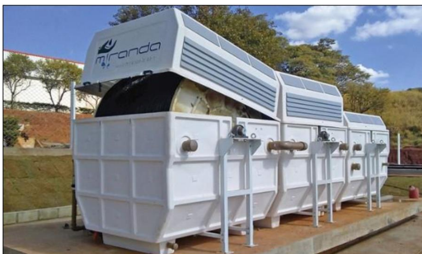
Figura 04 - Estação de tratamento de esgoto com módulos de biofilme no município de Mateus Leme/MG.

Por outro lado, alguns aspectos precisam ser observados para que um sistema por biofilmes funcione: Os biofilmes exigem manutenção regular em virtude do seu desprendimento e os custos iniciais de instalação podem ser mais elevados devido à necessidade de materiais de suporte para biofilmes. Na figura 04 demonstra uma aplicação de uma estação de tratamento de esgotos por biofilmes em Mateus Leme, Minas Gerais.