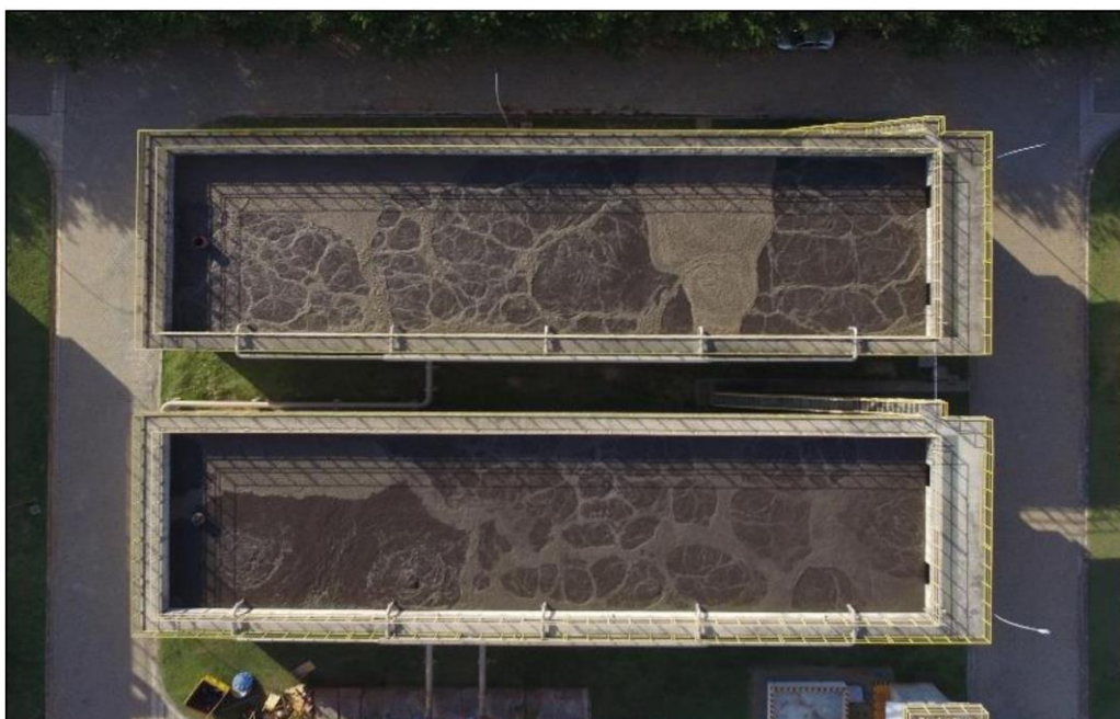
Figura 02. Tanques de aeração da estação de tratamento de esgoto ETE processo lodo ativado.

O sistema de tratamento de esgoto por lodos ativados, segundo Jordão e Pessoa (2011, p. 65) e Von Sperling (2014, p. 30), é um processo biológico amplamente utilizado para remover poluentes e matéria orgânica do efluente. O sistema envolve a aeração do efluente com a introdução de oxigênio por equipamentos mecanizados e a presença de microrganismos aeróbios (bactérias) em um reator de lodos ativados. Nas figuras 02 e 03 são apresentadas uma imagem real de uma estação de tratamento e o procedimento com lodo ativado.